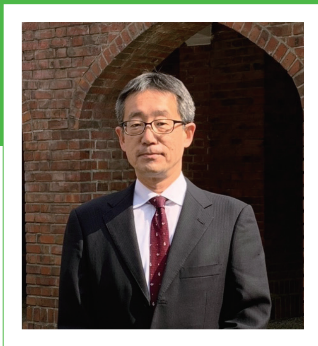
株式会社ブレインピックス 代表取締役 立教大学観光学部 特任教授