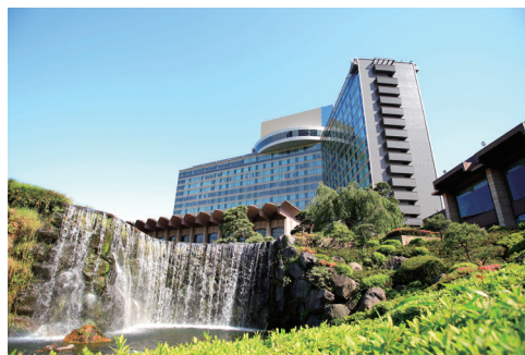
ホテルニューオータニ外観