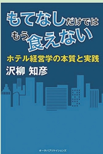
沢柳氏の著書『もてなしだけではもう食えない』(オータパブリケーションズ)

沢柳: 『もてなしだけではもう食えない』ですね。宣伝、ありがとうございます(笑)。