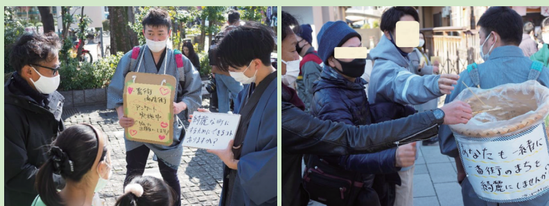
「まちをきれいに」と楽しく思いを伝える「商店街の人たち」と、それに応える「観光客」(2022年3月)

その地の魅力や価値は、双方向の思いを交錯させることで、また、地の文脈を見える化し、物語性を持たせることで持続可能となる。