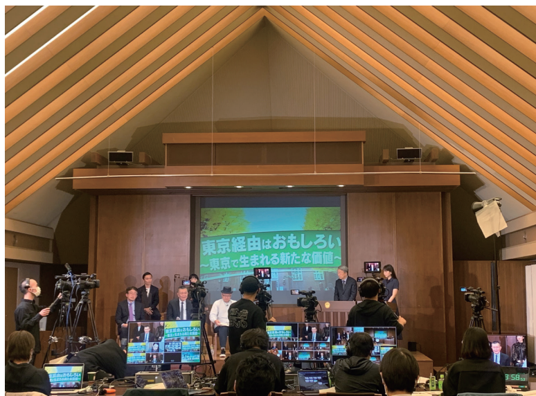
YouTube LIVE および LINE LIVEにて配信した